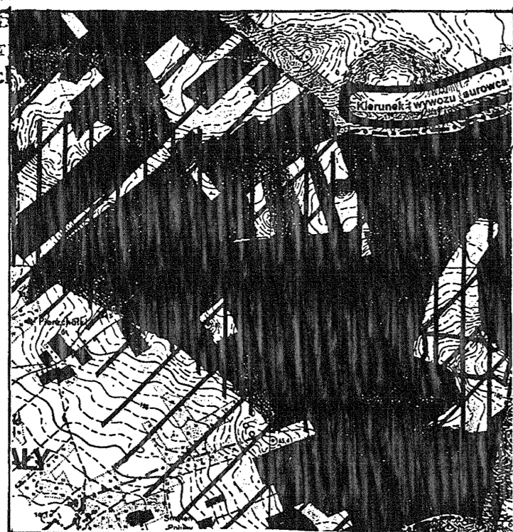
fragment „Studium uwarunkowań i kierunków zagospodarowania przestrzennego gminy”

GEODETA UPRAWNIONY Zaśw. Min. GP i Bud. Nr 14977 mgr inż. Marek Marchwicka 06-300 Przasnysz, ul. Piłsudskiego 4 tel. (0-478) 21-33