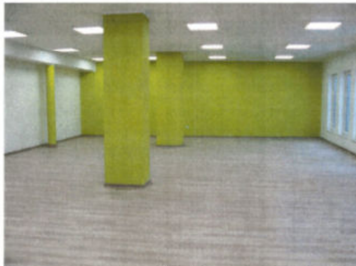
Sala biblioteczna powstała w ramach projektu dofinansowanego ze środków MKiDN

Pracą Gminnej Biblioteki Publicznej w Czernicach Borowych kieruje Kierownik. W instytucji zatrudnione są dwie osoby na pełnym etacie, w tym jedna na stanowisku merytorycznym. Osoby te bardzo dobrze znają zbiory, troszczą się o ich wzbogacanie, są otwarte na potrzeby i oczekiwania użytkowników. Poza tym, na podstawie umowy zlecenia zatrudniony jest instruktor śpiewu, który prowadzi ćwiczenia śpiewu wraz z akompaniamentem dla osób z Klubu Seniora oraz zajmuje się przygotowaniem programów słowno-muzycznych związanych z uroczystościami gminnymi.