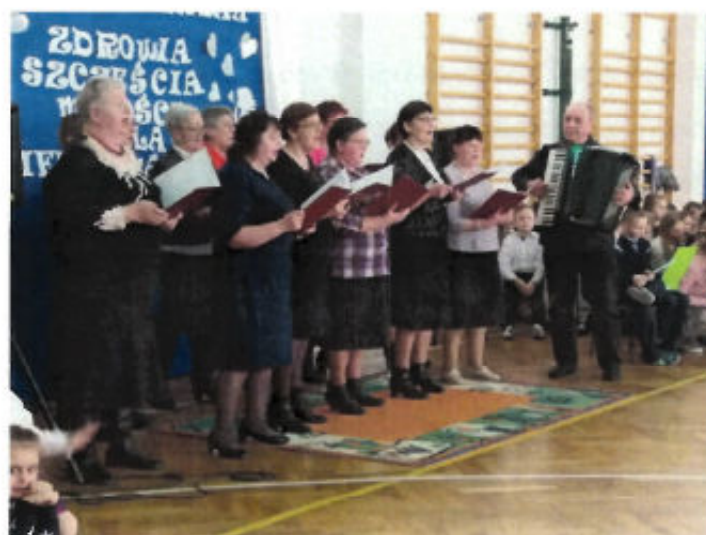
Występ Klubu Seniora podczas Dnia Babci i Dziadka

Przy Bibliotece działa Klub Seniora, którego głównym celem działalności jest integracja środowiska seniorów, a także rozszerzenie oferty kulturalnej i turystycznej, obejmującej w szczególności: organizację spotkań okolicznościowych, wieczorów towarzysko-tanecznych, spotkań, prelekcji, wycieczek krajoznawczych; włączanie się w organizację uroczystości i pikników na terenie gminy oraz poza nią; promocja Klubu Seniora, Gminnej Biblioteki Publicznej w Czernicach Borowych oraz Gminy Czernice Borowe. Członkowie Klubu aktywnie uczestniczą w warsztatach muzycznych, organizowanych przez Bibliotekę. Są niebywałą pasją i zaangażowaniem, popularyzują folklor śpiewny Północnego Mazowsza oraz programy słowno-muzyczne, przygotowywane przez instruktora śpiewu.